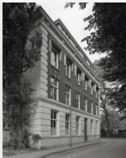
pand Wittevrouwenkade 6

De Vrouwenbibliotheek klaagt al in 1989 over krapte en zoekt een grotere ruimte. De voorbereiding voor een nieuw Vrouwenhuis (Emancipatiecentrum), met daarin een belangrijke rol voor de Vrouwenbibliotheek, heeft echter heel wat jaren geduurd.